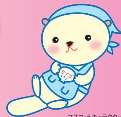
マスコットキャラクター 「かいごん」